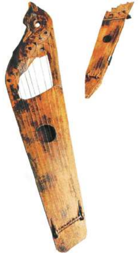
Древнерусские музыкальные инструменты: гусли и сопели. Музей музыкальной культуры им. М. И. Глинки,