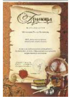
Фото 15. Грамота