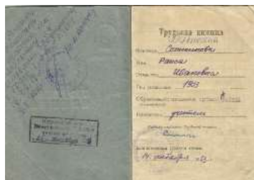
Фото 4. Трудовая книжка Малыхиной Раисы Ивановны, титульный лист