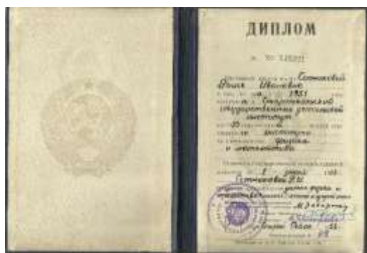
Фото 3. Диплом об окончании Старооскольского пединститута.