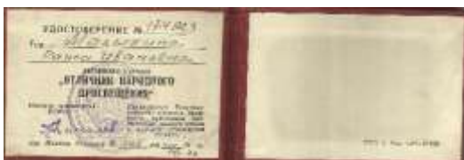
Фото 7. Удостоверение «Отличника народного просвещения РСФСР», август 1974 года.