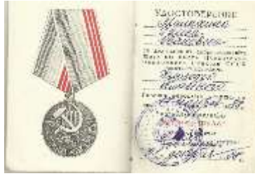
Фото 14. Удостоверение «Ветерана труда», 1988 год