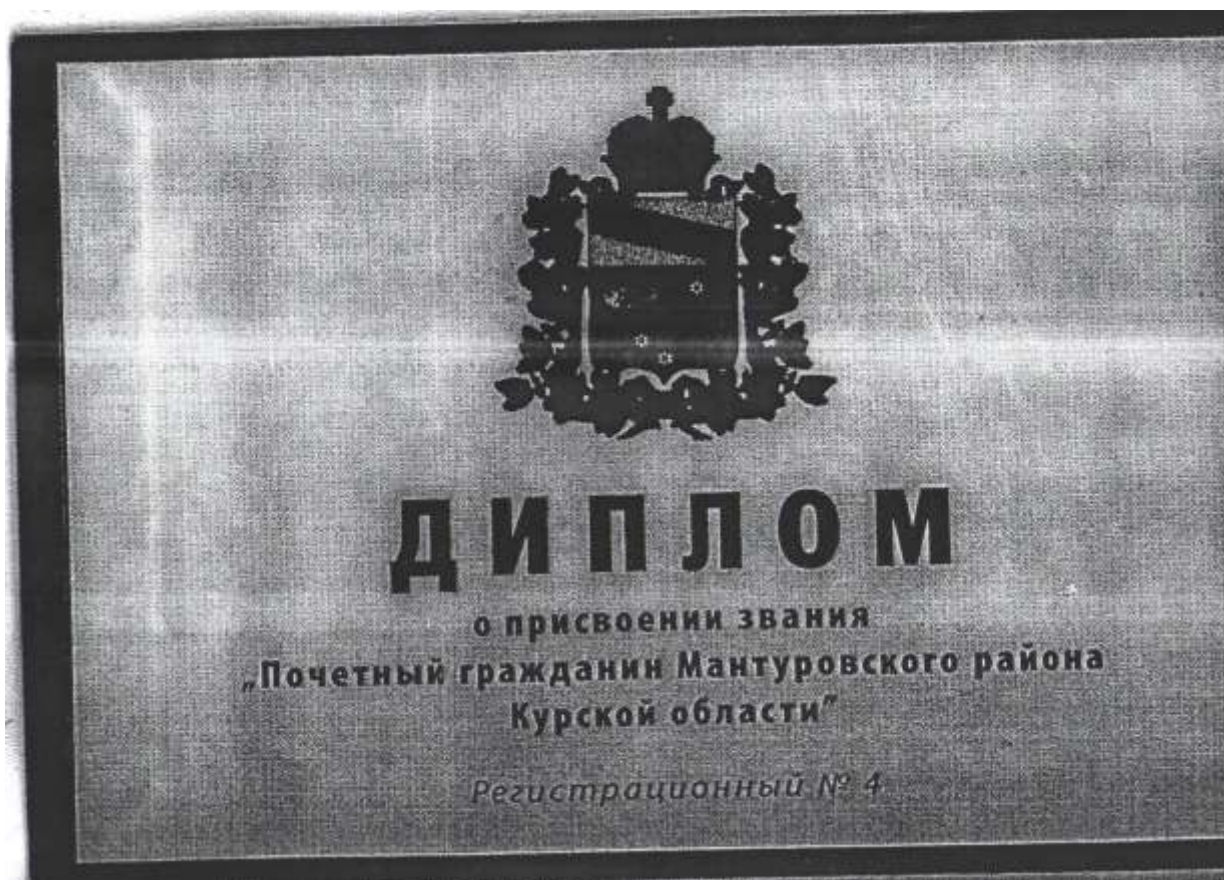
Фото 19. Диплом о присвоении звания «Почётный гражданин Мантуровского района», 2007 год