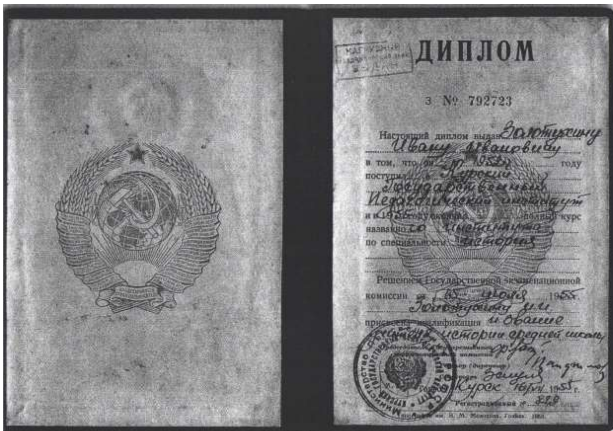
Фото 14. Диплом Курского государственного педагогического института, 1955 год