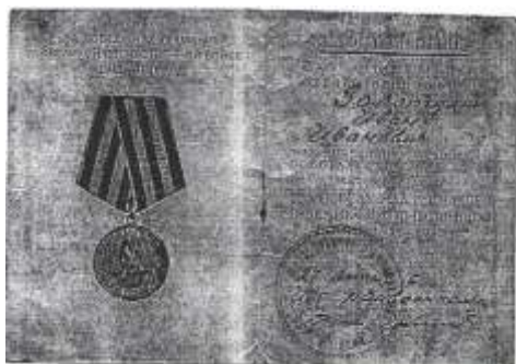
Фото 2. Удостоверение за участие в Великой Отечественной войне, 24 апреля 1946 г.