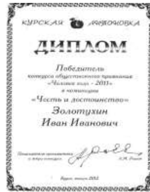
Фото 5. Диплом Победителя конкурса общественного признания «Человек – 2011» в номинации «Честь и достоинство»