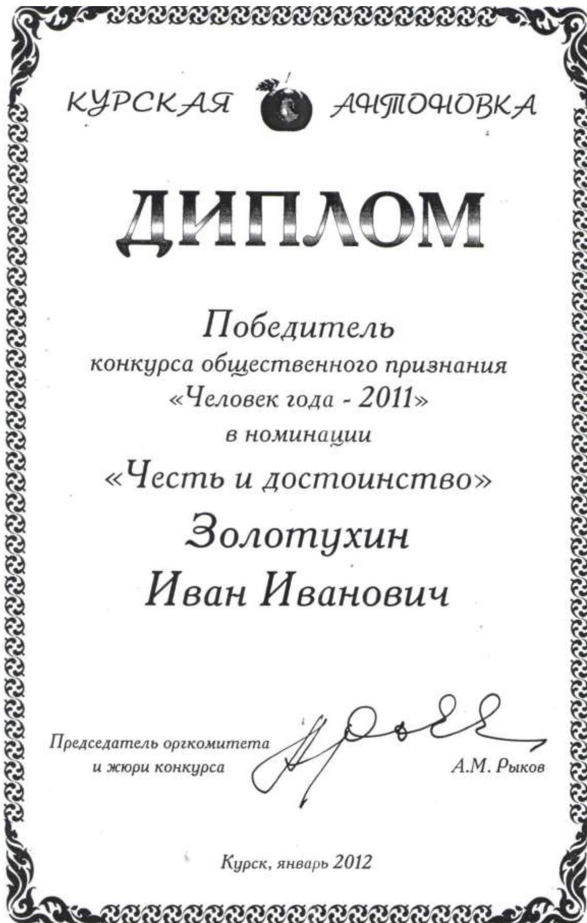
Фото 36. Диплом победителя конкурса общественного признания «Человек года – 2011», 2012 год