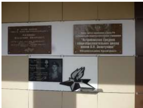
Фото 12. Вывеска с названием школы в честь И. ИМ. Золотухина у входа в школу.

появилась новая вывеска, изготовленная из мрамора, на которой был высечен текст: «Министерство образования и науки РФ Муниципальное общеобразовательное учреждение «Ястребовская средняя общеобразовательная школа имени И. И. Золотухина».